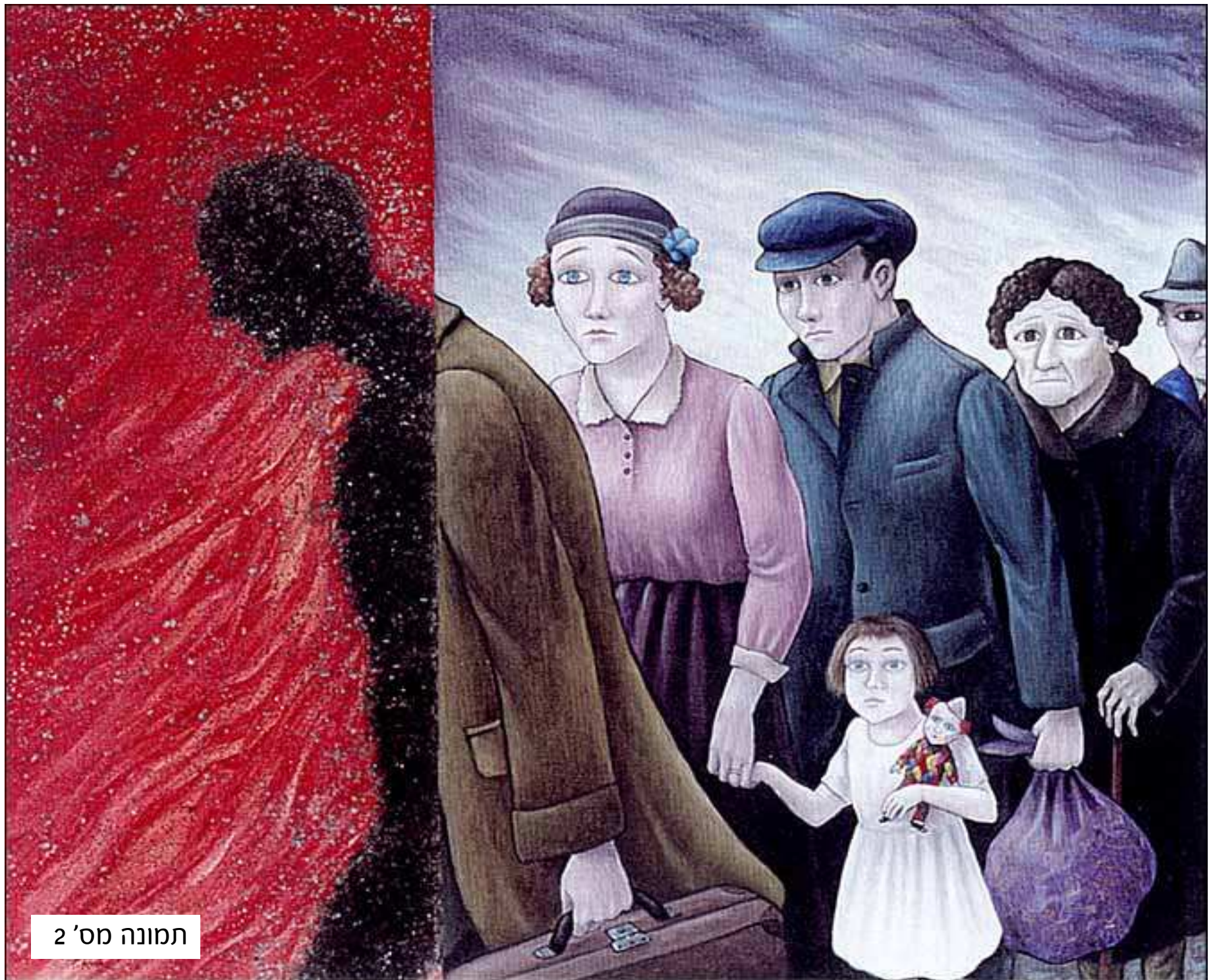
תמונה מס' 2