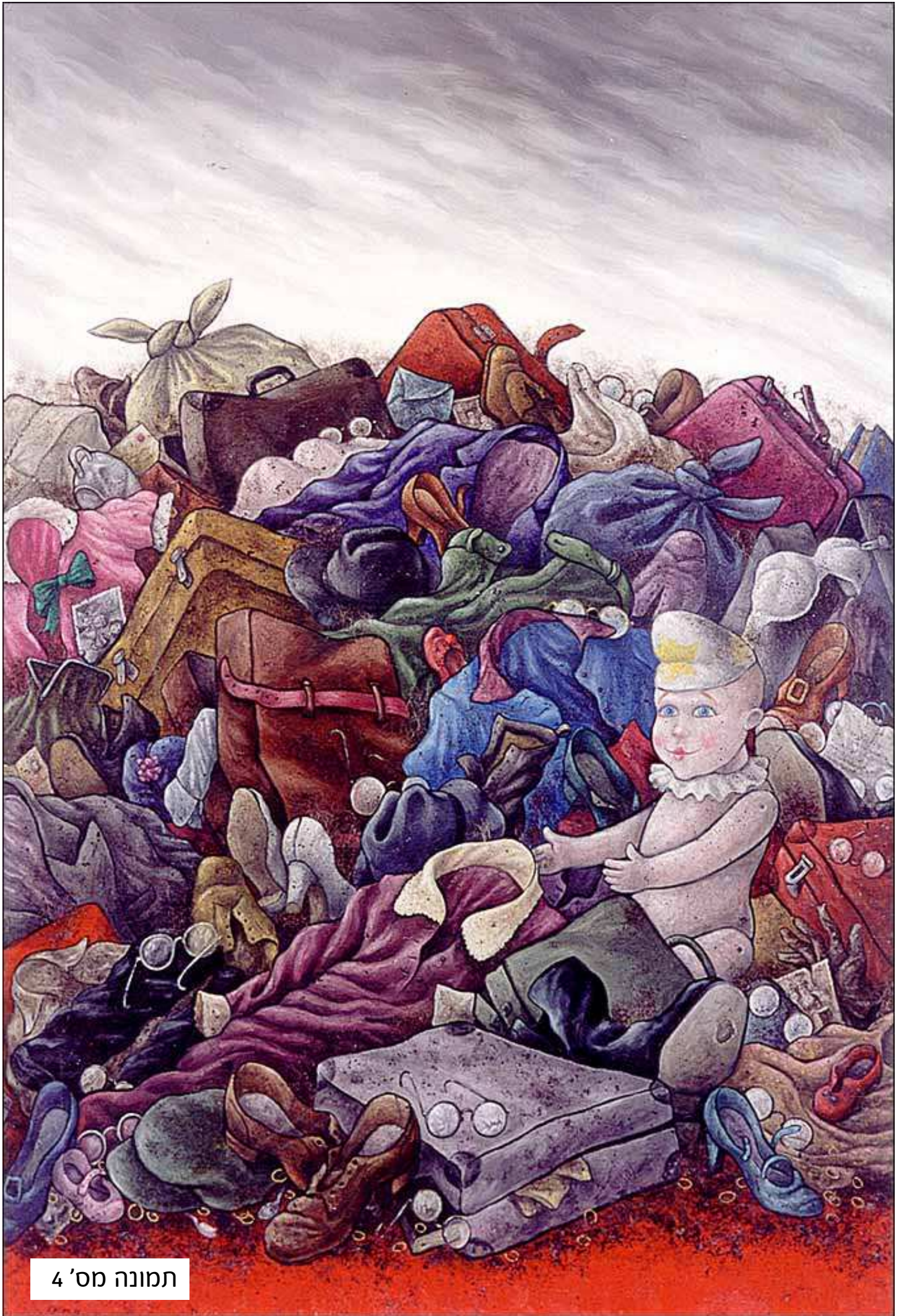
תמונה מס' 4